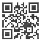
龍ヶ崎市立電子図書館

【龍ヶ崎市立電子図書館】 https://ryutosho.overdrive.com