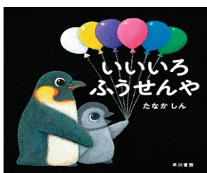
「いいいろふうせんや」 (早川書房)